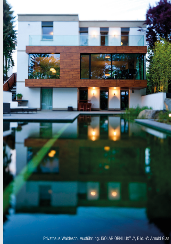
Privatthaus Waldesch, Ausführung: ISOLAR ORNILUX® // Bild: © Arnold Glas